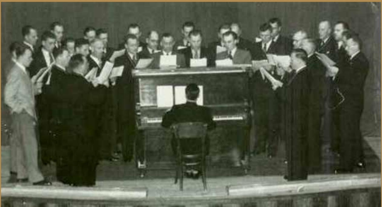
1951 repetitie aan de piano